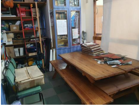
Wiosną było włamanie (stan 2022-03-19)