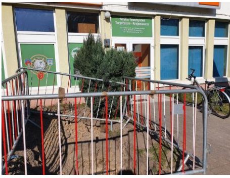
19 marca 2022 r. były naprawiane przyłącza