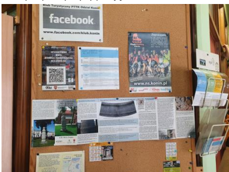
Po pandemii działalność wrze w internecie.

26.06.2022 Rowerowy Rajd Słupa Konińskiego