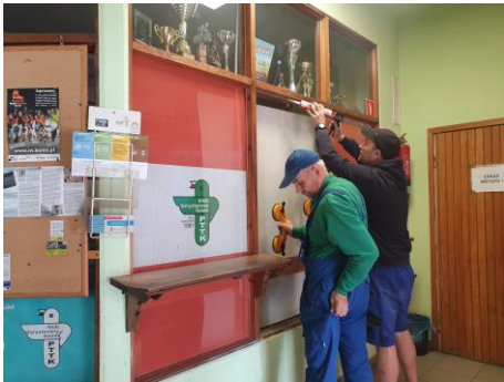
31 maja 2022 r. szklarze wprawili szybę