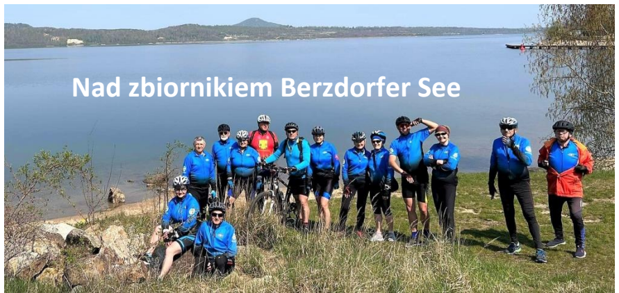
Nad zbiornikiem Berzdorfer See