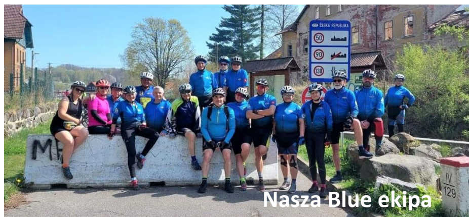
Nasza Blue ekipa