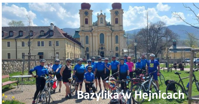
Bazylika w Hejnicach

Dzień drugi 1 maja – wraz z naszymi przewodnikami dzisiaj w większości po czeskiej ziemi, i tak odwiedziliśmy Hermanice, bazylikę w Hejnicach, oraz miejscowość Frydland z historyczną zabudową w rynku oraz zamek posiadający fascynującą historię.