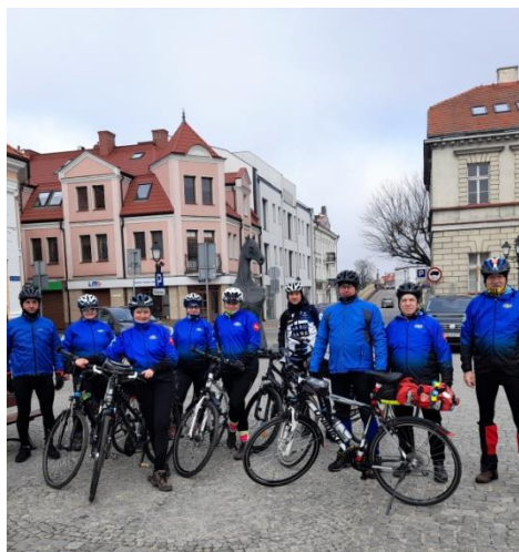
Start tradycyjnie spod Kunia

27-02-2022 r. - wykorzystując sprzyjającą aurę ☀️🌞 Blue cykliści 🚴🚴🚴, nie mogąc wysiedzieć w domu ,postanowili tak "dla zdrowotności" odwiedzić ciekawe miejsca w najbliższej okolicy i tak padło na "Zagrodę Borowo" ,pałac w Kościelcu z przylegającym parkiem i na koniec miejsce pamięci w Turach. Co tu gadać ,było fajnie, jak to zwykle u nas bywa. Zapraszamy na kolejne weekendowe wypady z CIKLO PTTK .