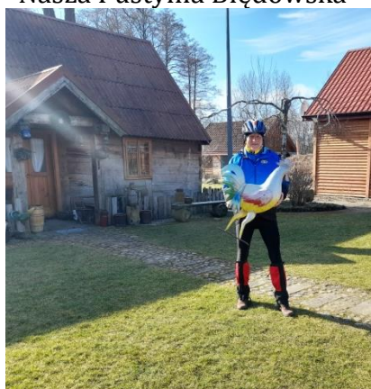
Kogucik na rosołek