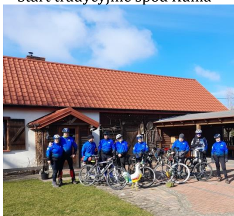
W Zagrodzie Borowo