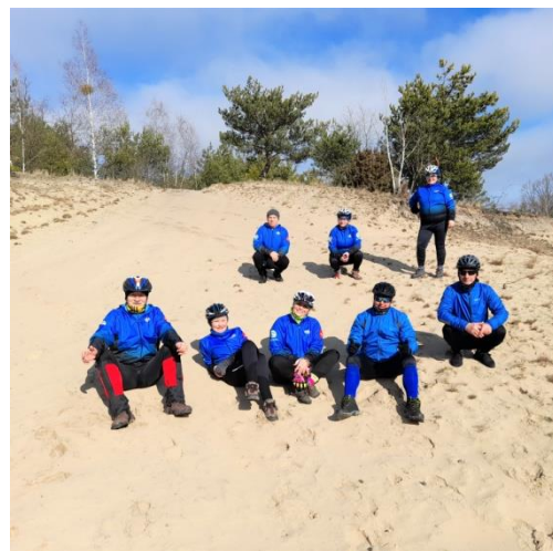
Prawie jak na plaży