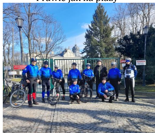
Przed zamkniętą bramą