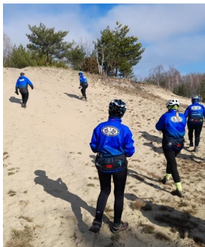
Nasza Pustynia Błędowska