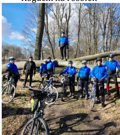
Tenże sam park