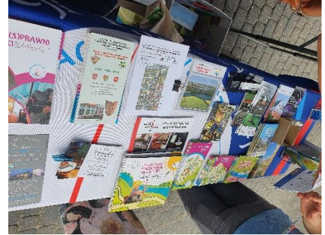
Podczas XIV Jarmarku św. Bartłomieja w Koninie 22.08.2021 r.