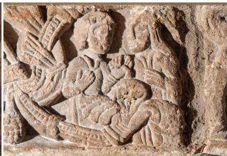
W tej Sali znajduje się tympanon fundacyjny.