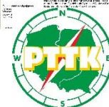
Oprac. W. Gruszczyńska