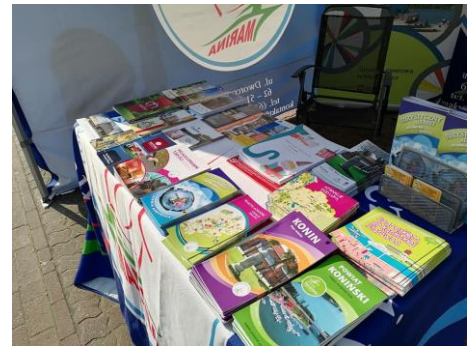
100 składanek wyłożyły pracownice Centrum Informacji Turystycznej w Koninie na Jarmarku Średniowiecznym w Gnieźnie 24-25.07.2021 r.