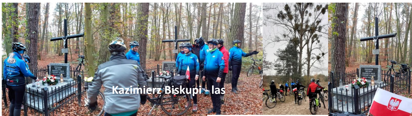
Kazimierz Biskupi las

Obchodzenie Święta Niepodległości na trwałe wpisało się w naszą Blue działalność i mimo przeciwności 11 listopada 2020 roku w okrojonym składzie, odwiedziliśmy miejsca pamięci Powstańców Styczniowych z 1863 roku, nagraliśmy film do #PomocDlaOleczka, podjęliśmy zobowiązanie aby do 15 listopada przejechać rowerowo 2020 km (zgodnie z aktualnym rokiem – norma została przekroczona). No a na koniec, nad jeziorem Gosławskim przy palącym się ognisku, powspominano minione lata i wstępnie pomyślano co nas czeka w nadchodzącym 2021 r.