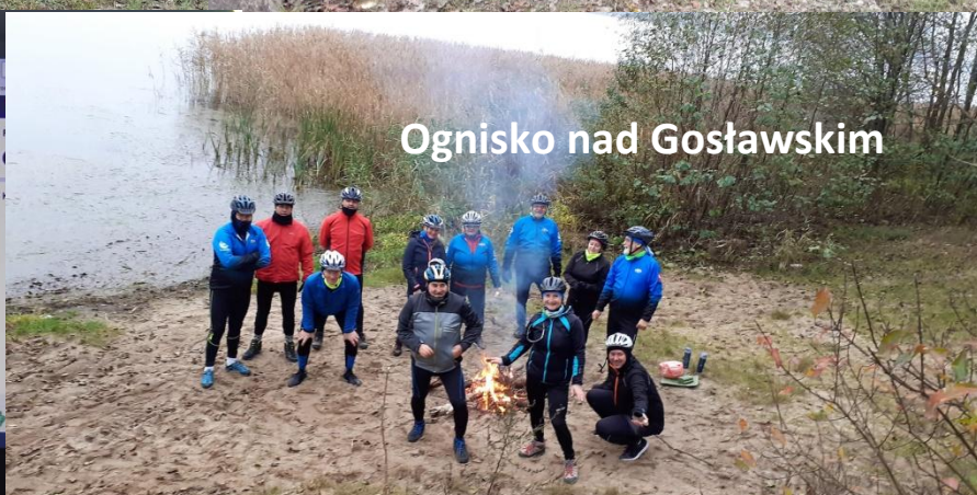
Ognisko nad Gosławskim