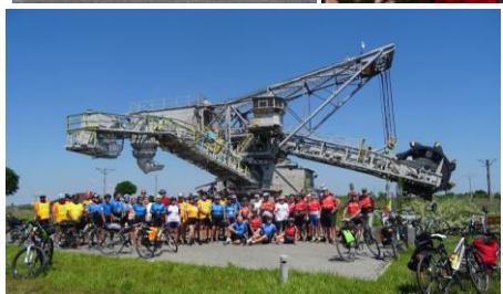
Kleczew – koparka