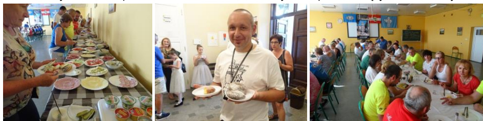
Wspaniałe warunki pobytu, działania Biura Rajdu i wyżywienie (ach te pączki!) zapewniła Bursa Zespołu Szkół Ekonomiczno – Usługowych w Żychlinie. Tekst: A. Łącki