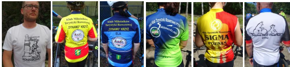
Koszulka rajdowa ze Słupem Konińskim i koszulki niektórych zespołów biorących udział w rajdzie.