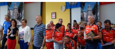
Najliczniejsza drużyna - STR Milanówek, PTTK Strzelno, pozostałe drużyny otrzymały puchary za uczestnictwo: Pałuki Tour Wągrowiec, KTR SIGMA Poznań, MTR Dynamo Krzyż, PKTR PTTK Jednoślądk Piła