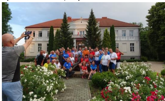
Przed siedzibą Zespołu Szkół w Żychlinie przy pomniku młodego Frydka Chopina