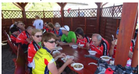
Posiłek i spotkanie z motocyklistami w Ślesinie