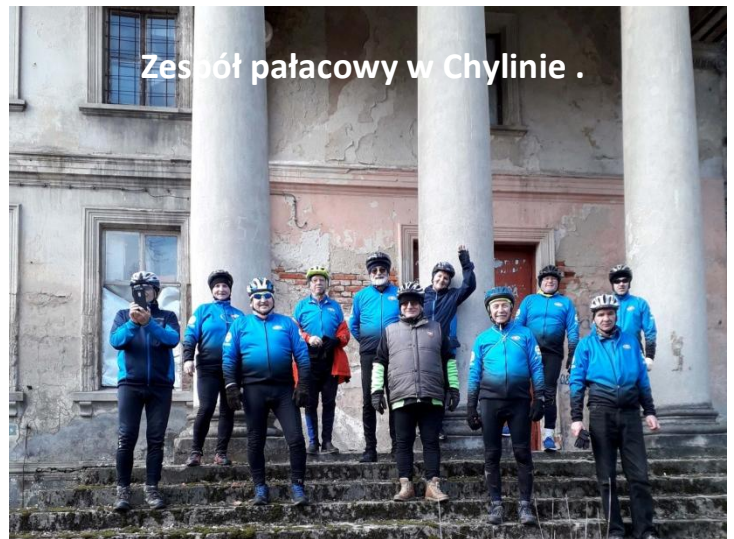
Zespół pałacowy w Chylinie .