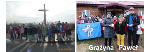
Młodzież przy krzyżu Zdobywcy srebrnej TZK