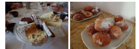
Ciasta z Józefowa i zarzewskie pączki