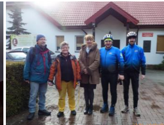
Fot. W. Gruszczyńska (tekst), Z. Szczypkowski