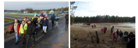
Wiadukt w Strudze