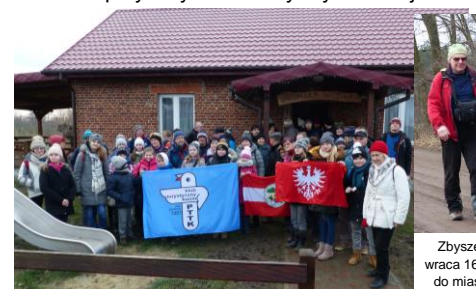
Pożegnalne zdjęcie przed świetlicą w Zarzewie