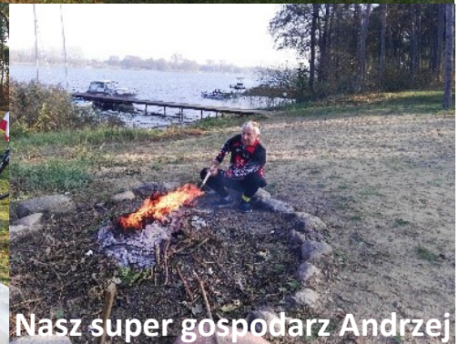
Wspólne biesiadowanie nad Jeziorem Mikorzynskim