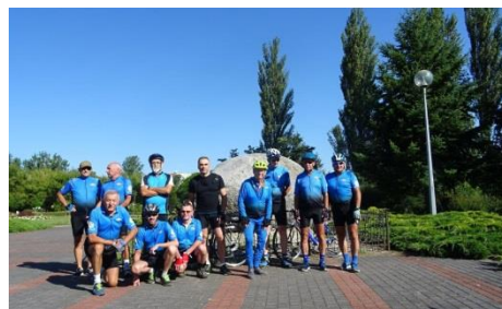
Na starcie w Koninie