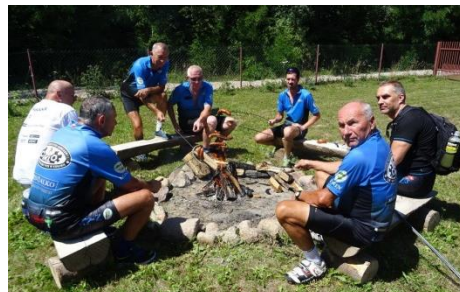
Cyklista posilić się musi