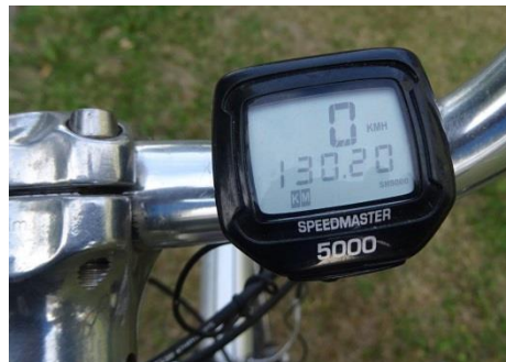
Tyle mi wyszło 😊. 130 km pętko 😊