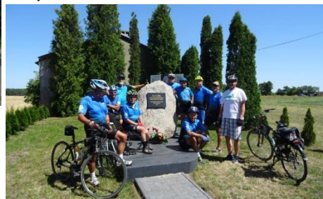
Przy okazji odwiedziliśmy miejscowość, gdzie urodziła się matka Fryderyka Chopina - Długie