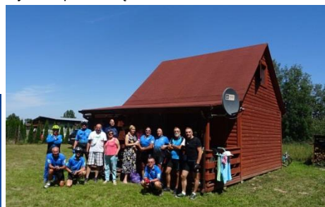
Gospodarze i goście