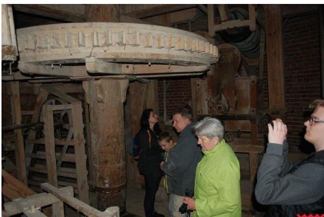
W holenderskim wiatraku

Pod koniec kwietnia grupa MURall rozpoczęła układanie mozaiki na schodach.