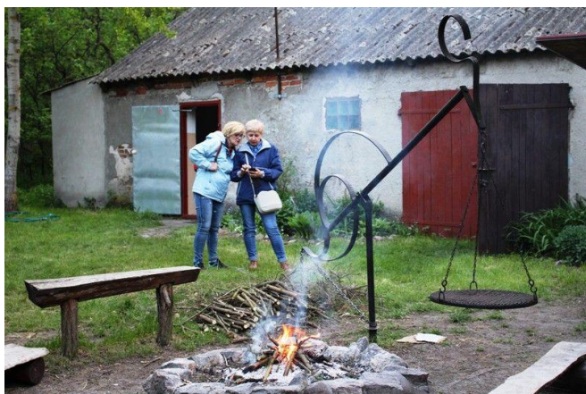
Ognisko w Chatce Ornitologa PTTK