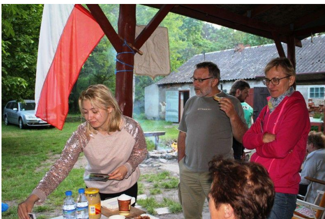
Wytnienie na cieniście ganku CHATKI ORNITOLOGA PTTK było cenne dla piechurów