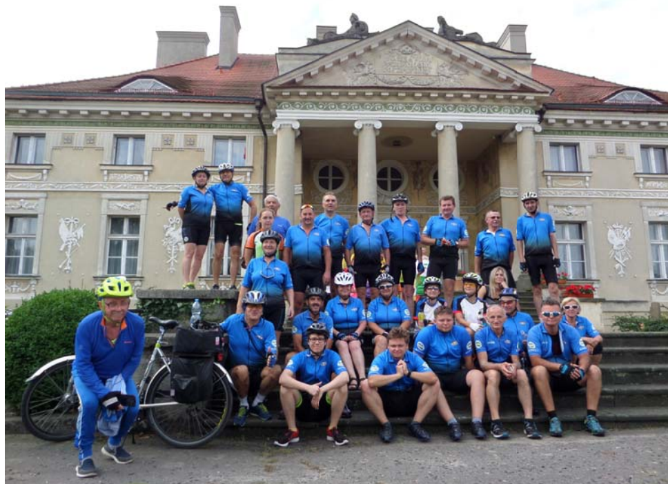
Najliczniejsza drużyna rajdu - STR CIKLO PTTK Konin - w Lewkowie