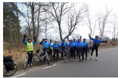
Jak widać powitanie było nadzwyczaj gorące.