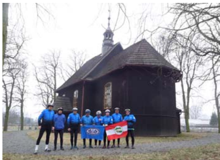
Kamienna w parafii Iwanowice.