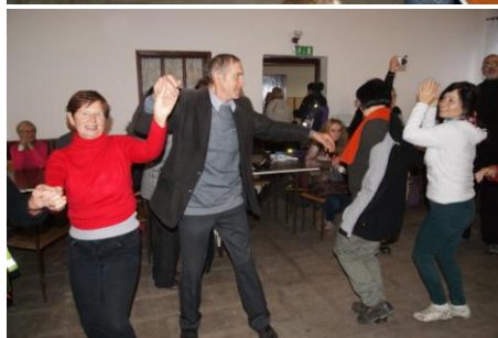
Zabawa w sali sołeczkiej w Kozarzewku.