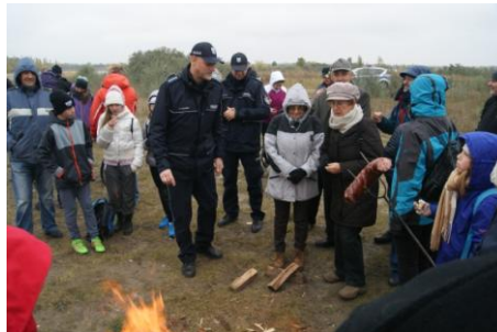
Ognisko na południowym cyplu półwyspu.