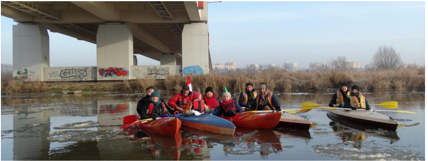
5 załóg noworocznego spływu kajakowego w Koninie pod mostem Unii Europejskiej w Koninie