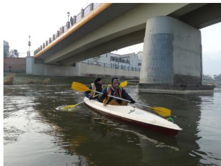
Klubowe kajaki pod mostem Toruńskim