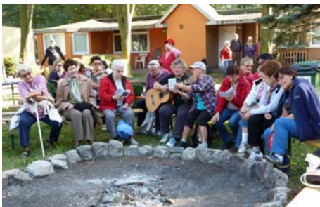
Jak dobrze nam zdobywać góry ....