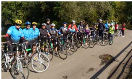
CIKLOiści poznawali obiekty hydrograficzne.

Więcej zdjęć: http://www.konin.pttk.pl/index.php?id=zdjecia ; https://www.facebook.com/klub.konin