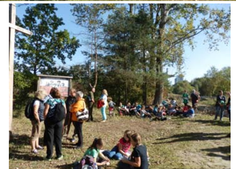
Miejsce bitwy 22.03.1863 pod Olszowym Młynem