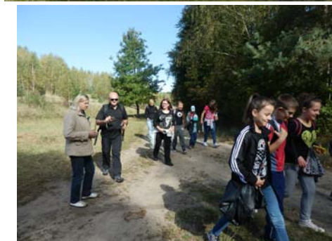
10 lat trwa współpraca z ZSP nr 2 w Lubstowie