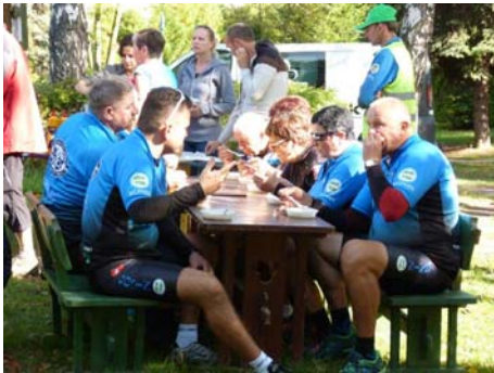
W plażowym menu były kielbaski z grilla, kielbaski na ognisku i żurek.