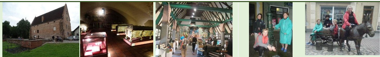
Muzeum – Zamek Opalińskich w Sierakowie