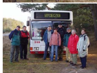
Brzezińskie Holendry Uczestnicy II etapu (nie wszyscy)